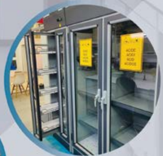
ARMOIRE DE STOCKAGE